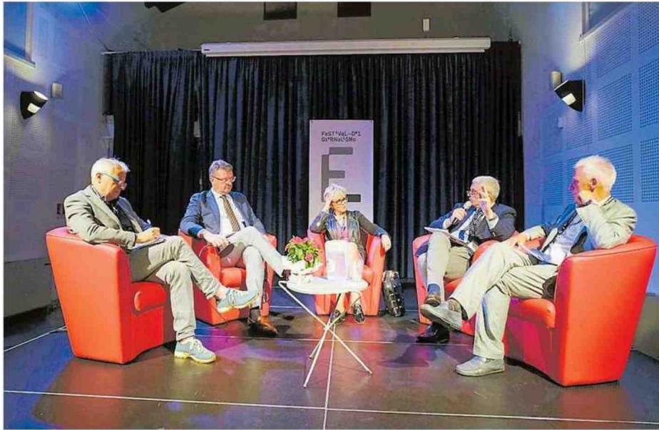
L'incontro, ieri sera, dedicato al Giallo e al giornalismo d'inchiesta